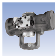
Agitateur type R (option).

Kit 105451* L20 agitateur alternatif pour les réservoirs sous pression 183S-1012-CE & 183G-1012-CE