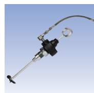
Agitateur type D

Remarque: les réservoirs Binks sont fournis avec des raccords NPS standard. Pour les raccords BSP, ajouter un "B" à la référence. Exemple: 183S-210-CE-B