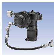
Agitateur type I