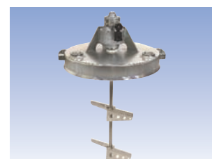
Inclut système d'entraînement 31-401